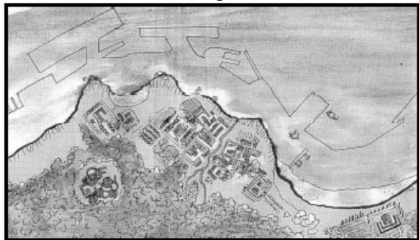
Representación da costa viguesa no século II, en comparación co seu perfil actual.

Estas novas técnicas industriais provocan un cambio na conformación socio-económica e laboral da poboación local, pero tamén levan consigo unha forte presión sobre os ecosistemas mariños, tanto locais como oceánicos, dándose xa os primeiros fenómenos de sobreexplotación do mar. Tamén teñen lugar as primeiras actuacións modificadoras e artificializadoras do litoral. En Vigo, os primeiros aterrramentos (recheos) para a construción e ampliación das instalacións portuarias datan de 1865. Poucos anos máis tarde ganáranse ao mar os terreos entón chamados da Nova Poboación, a actual Alameda.